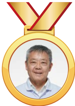
儲富有 校長 獎項成立委員