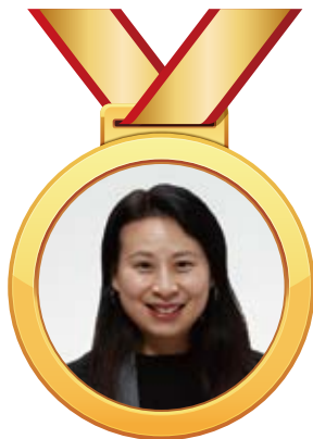
文詩詠 校長 香港直接資助學校議會