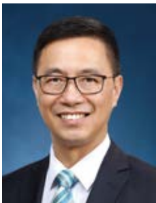
楊潤雄 太平紳士 教育局局長