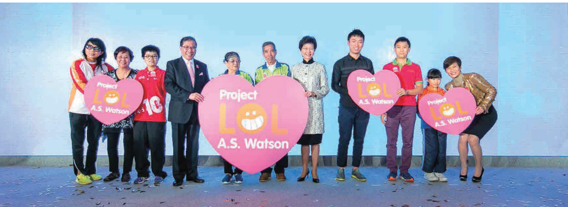
行政長官林鄭月娥，GBS, JP (右五，時為政務司司長) 及屈臣氏集團董事總經理黎啟明先生 (左四) 為計劃主持啟動儀式