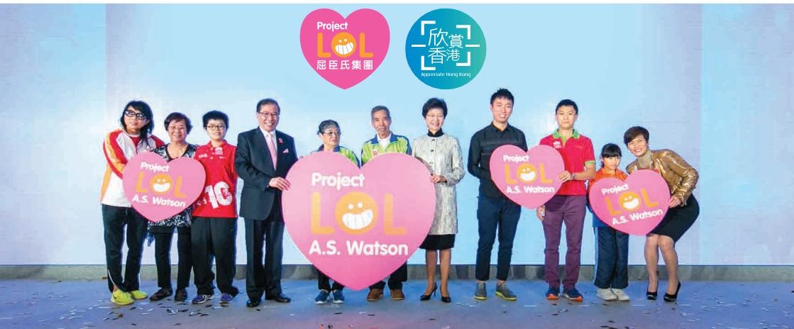
香港特別行政區政務司司長林鄭月娥, GBS, JP (右五)及屈臣氏集團董事總經理黎啟明先生(左四)為計劃主持啟動儀式