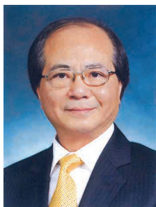
吳克儉 SBS, 太平紳士 教育局局長

衷心恭賀 30 名傑出學生運動員，獲選參加「天津運動交流團」，藉此拓寬視野，增廣見識。