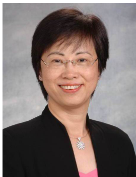
葉曾翠卿 太平紳士 教育局前副秘書長